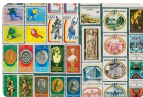
列支敦士登郵票博物館