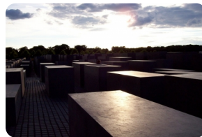
猶太人大屠殺紀念碑群