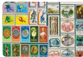
列支敦士登郵票博物館