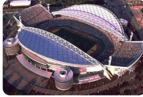
巴塞羅那奧林匹克體育場