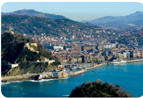
聖塞瓦斯蒂安老城