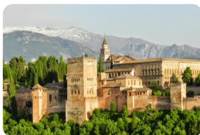
阿爾罕布拉宮 [阿爾罕布拉宮]

阿爾罕布拉宮，又叫“紅堡”，是阿拉伯式宮殿庭院的代表，位於格拉納達城外的內華達山上。作為伊斯蘭教建築與園藝完美結締的建築，阿爾罕布拉宮早在1984年就已經被聯合國教科文組織選入世界文化遺產名錄之中。