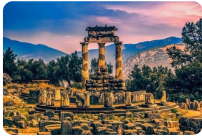
德爾菲遺址和博物館

*由於途經阿拉霍瓦小鎮當地不可抗力山崩落石導致道路封閉，目前官方尚未給到具體公路開放的明確日期。如果道路持續關閉，將影響原行程“阿拉霍瓦小鎮”無法途徑漫觀。如團隊行程當日道路暢通安全，原行程不變。如團隊行程當日道路持續關閉，行程將調整為第二天返回雅典路上漫觀【溫泉關遺址】——古斯巴達城國王 LEONIDAS 及三百壯士紀念碑。