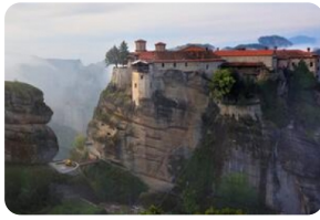
梅黛奧拉天空之城

(注：6座脩道院的開放時間各不相同，祇備天情況選擇可以漫觀的脩道院，一般漫觀2座脩道院。脩道院有嚴格的著裝規定，不得裸露肩膀或膝蓋，女性必須穿裙子。如果沒有裙子，脩道院門口提供圍裙可以借用，請在入場前借一條。)