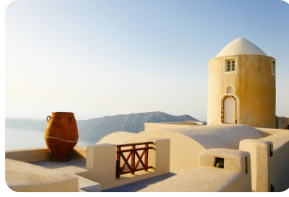
菲拉 (FIRA) 小鎮