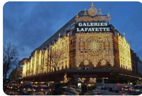
老佛爷百货公司 (奥斯曼旗舰店)