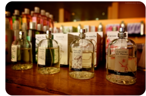
巴黎花宫娜香水博物馆