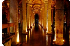
耶莱巴坦地下水宫