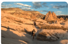
格雷梅露天博物馆

热气球随风飞向卡帕多奇亚的山谷，进行一次神奇的空中之旅，高空欣赏世界上唯一的卡帕多奇亚的精灵烟囱，仿佛置身于另一个世界，在村庄、葡萄园，果园点缀的“月球表面”上空徘徊大约45分钟至1小时。着陆后当地给每人颁发一份证书，并赠送一杯香槟庆祝这次成功的空中历险。