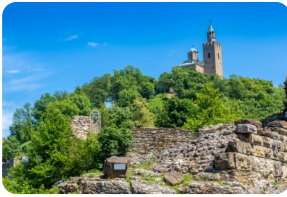
大特尔诺沃古城堡