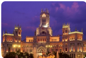
科尔多瓦大清真寺