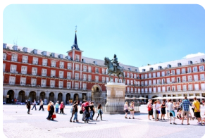
马德里马约尔广场