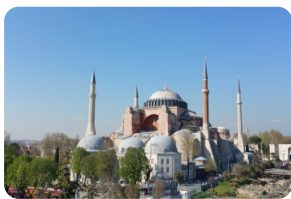
圣索菲亚清真寺博物馆