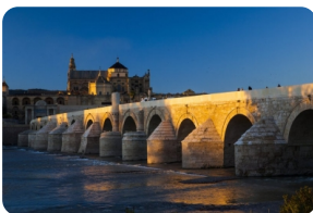
科尔多瓦古罗马桥