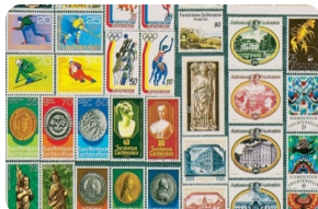
列支敦士登邮票博物馆