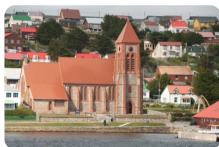
福克兰群岛斯坦利港