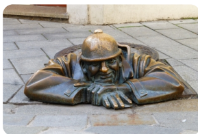
街尾巷间的绝妙雕像