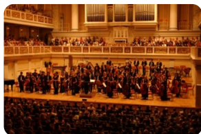
Johann Sebastian Bach 音乐学院