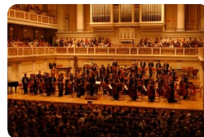
Johann Sebastian Bach 音乐学院