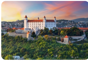
布拉迪斯拉发城堡