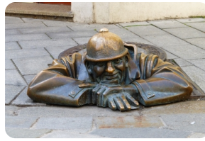
街尾巷间的绝妙雕像