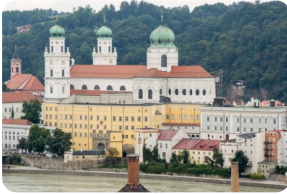
圣斯蒂芬主座教堂