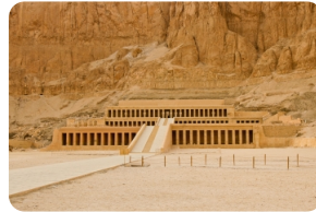
哈特谢普苏特女王神庙