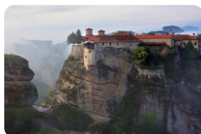
梅黛奥拉天空之城