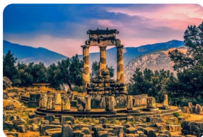
德尔菲遗址和博物馆

*由于途经阿拉霍瓦小镇当地不可抗力山体落石导致道路封闭，目前官方尚未给到具体公路开放的明确日期。如果道路持续关闭，将影响原行程“阿拉霍瓦小镇”无法途径参观。如团队行程当日道路畅通安全，原行程不变。如团队行程当日道路持续关闭，行程将调整为后一天返回雅典路上参观【温泉关遗址】——古斯巴达城国王 LEONIDAS 及三百壮士纪念碑。