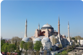
圣索菲亚清真寺博物馆

注：提前一天到达的客人可以选择团前加住和机场付费接机，加住客人第二天早上可以在加住酒店直接上团。