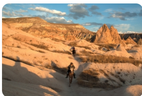
格雷梅露天博物馆