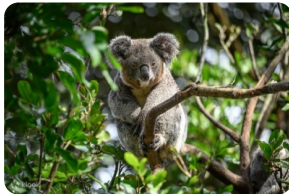
翎羽谷野生动物园