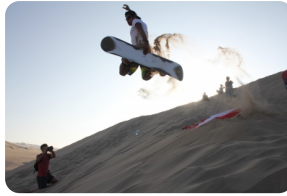
悉尼 - 滑沙