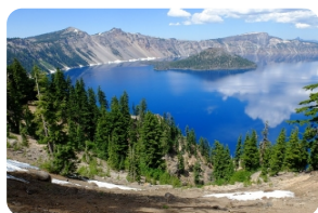
火山口湖国家公园

***特别说明：如遇火山湖国家公园关闭，届时景点将替换为海狮洞和雷神之井，敬请谅解。