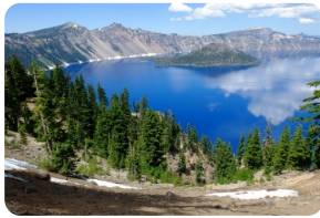
火山口湖国家公园

***特别说明：如遇火山湖国家公园关闭，届时景点将替换为海狮洞和雷神之井，敬请谅解。