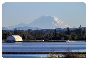
雷尼尔山国家公园