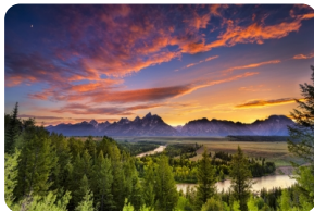
大提顿国家公园 [大提顿国家公园]

公园不大, 在东西南北四个方向有用鹿角搭建成的巨型拱门。鹿角全是尖货, 不过这些鹿角可不是捕杀所得, 是每年冬天大批的麋鹿从山里来到杰克逊的"国家麋鹿保护区"过冬, 春天鹿角自然脱落再更新, 麋鹿走后, 遍地留下无数的珍品。