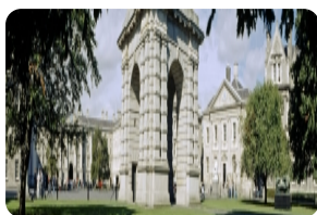
圣三一学院图书馆