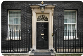
唐宁街10号英国首相府官邸