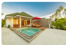
Sunset Pool Beach Villa