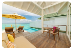
Lagoon Villa With Pool + Slide