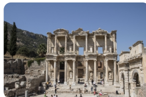
以弗所（埃菲斯）古城遗址