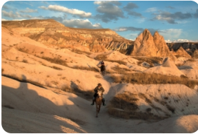
格雷梅露天博物馆