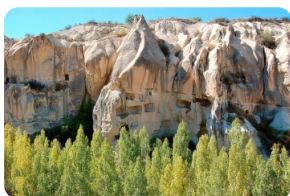
格雷梅露天博物馆