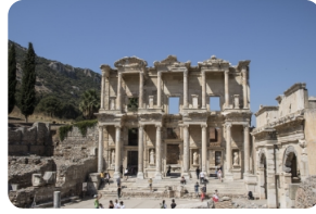
以弗所（埃菲斯）古城遗址