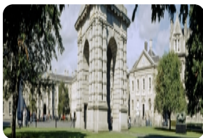
圣三一学院图书馆