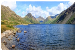
湖区国家森林公园