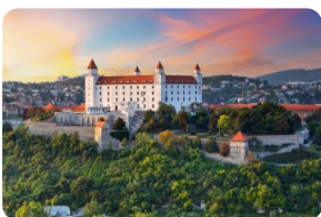
布拉迪斯拉发城堡