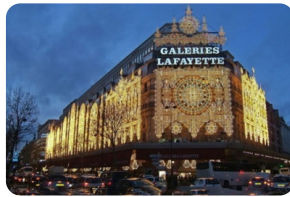
老佛爷百货公司（奥斯曼旗舰店）