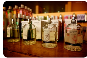
巴黎花宫娜香水博物馆