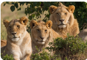
马赛马拉国家公园

注：途中可根据个人兴趣选择参观地球上最后一个原始部落-马赛村，参观费用：USD35/人