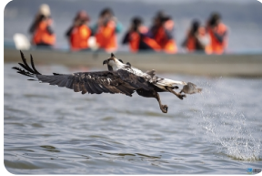
纳瓦沙湖(乘船游湖)