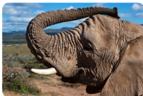
阿伯德尔国家公园