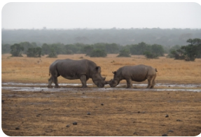
奥·佩杰塔自然保护区