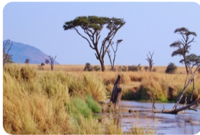
塞伦盖蒂国家公园