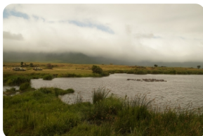
恩戈罗恩戈罗火山口