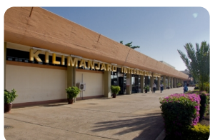
乞力马扎罗国际机场JRO