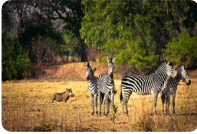
马赛马拉国家保护区

注：途中可根据个人兴趣选择参观地球上最后一个原始部落-马赛村，参观费用：USD35/人