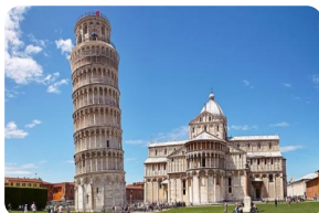
比萨斜塔及其周边