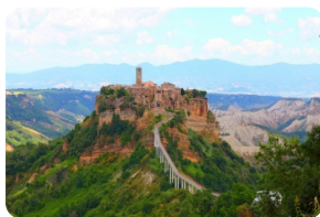
"天空之城"白露里治奥