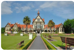
罗托鲁瓦市政花园

亮点:罗托鲁瓦市政花园、奎罗地热保护区公园、新西兰田园农场、红木森林、汉密尔顿花园、六国花园