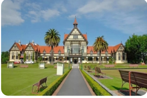
罗托鲁瓦市政花园

亮点:罗托鲁瓦市政花园、奎罗地热保护区公园、新西兰田园农场、红木森林、汉密尔顿花园、六国花园