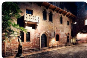
朱丽叶阳台与朱丽叶故居