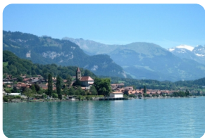
布里恩茨湖---瑞士最纯净的湖