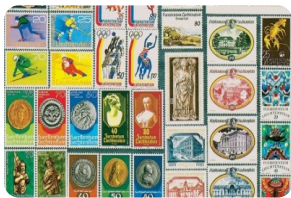
列支敦士登邮票博物馆

早餐后前往阿尔卑斯山少女海蒂和爷爷生活的地方【迈恩费尔德】，电影展现了美丽的阿尔卑斯山自然风光。海蒂虽是个虚构的人物，在迈恩费尔德却是活生生的存在，游玩【海蒂村庄】，穿越到海蒂生活的时代。之后前往邮票王国【列支敦士登】，这是一个以阿尔卑斯山美丽风光、低税制与高生活水准而著称的富裕小国。游览【列支敦士登邮票博物馆】，晚上入住苏黎世或其周边酒店。