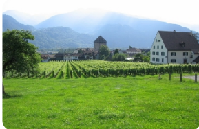
迈恩费尔德——童话小镇