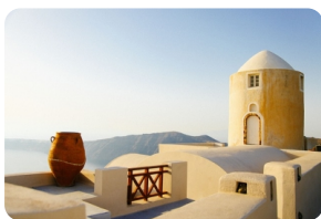
菲拉 (FIRA) 小镇