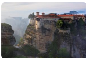
梅黛奥拉天空之城

（注：6座修道院的开放时间各不相同，视当天情况选择可以参观的修道院，一般参观2座修道院。修道院有严格的着装规定，女性穿裙子。如果没有裙子，修道院门口提供围裙可以借用，请在入场前借一条。）