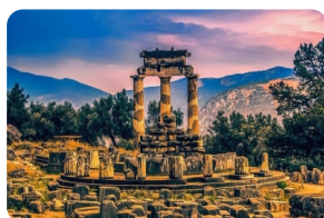
德尔菲遗址和博物馆

*由于途经阿拉霍瓦小镇当地不可抗力山体落石导致道路封闭，目前官方尚未给到具体公路开放的明确日期。如果道路持续关闭，将影响原行程“阿拉霍瓦小镇”无法途径参观。如团队行程当日道路畅通安全，原行程不变。如团队行程当日道路持续关闭，则直接前往德尔菲博物馆。