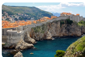
杜布罗夫尼克城墙