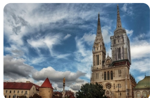
圣母升天大教堂（萨格勒布大教堂）

早餐后前往克罗地亚首都---萨格勒布，欣赏哥特式建筑--【萨格勒布大教堂】，对比圣马可广场的【圣马可教堂】，感受不一样的教堂内饰与文化，站在失恋博物馆前洛特尔萨克塔的观景台俯瞰老城。夜宿萨格勒布或其周边酒店。