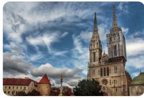
圣母升天大教堂 (萨格勒布大教堂)