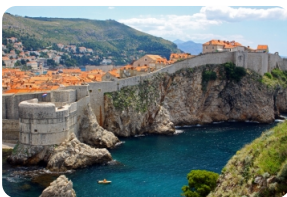
杜布罗夫尼克城墙