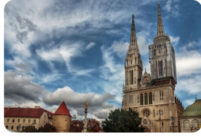
圣母升天大教堂 (萨格勒布大教堂)