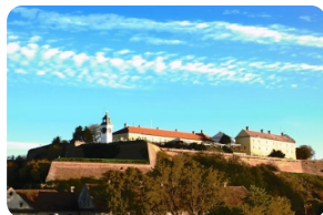
彼德罗瓦拉丁堡垒