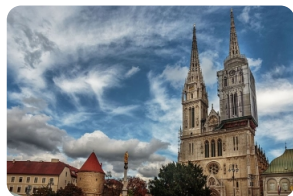
圣母升天大教堂 (萨格勒布大教堂)