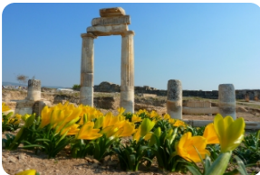
HIERAPOLIS古城遗址 [HIERAPOLIS古城遗址]