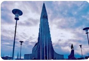
哈尔格林姆斯教堂