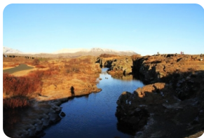
冰岛古议会旧址(露天议会)

早上从雷克雅未克出发，前往景点线路黄金圈进行游览。【辛格维利尔国家公园】是冰岛大陆上唯一被联合国教科文组织认证为世界文化遗产的地点，也是冰岛的古代议会旧址。【盖歇尔间歇泉】每次喷发过程大约持续1~2分钟，然后渐归平息。这一过程周而复始，不断反复，十分壮美。【黄金瀑布】有两层落差，水汽磅礴，呼啸而下，奔流入谷。在阳光的照射下，瀑布喷溅的水珠折射出一道彩虹，散发着锻金般的光彩，瀑布也因此得名。当晚入住南部小镇。*如果天气条件允许，当晚可在酒店附近看到极光。