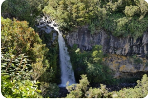
艾格蒙特国家公园