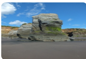
The three sister