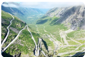
特罗斯蒂山路（精灵之路）