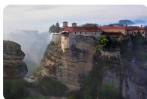
梅黛奥拉天空之城

本网页内所标注时间均为参考时间，实际抵达时间会因各种不可抗力原因如天气，堵车，交通意外，节日赛事，骚乱罢工等有晚点可能，还请您谅解。您如有后续行程安排需搭乘其他交通工具前往其他城市，我们强烈建议您至少预留3小时以上的空余时间，以免行程延迟受阻为您带来不便。由于您没有预留足够的空余时间而导致的自行安排行程有所损失，我公司概不负责，敬请谅解。